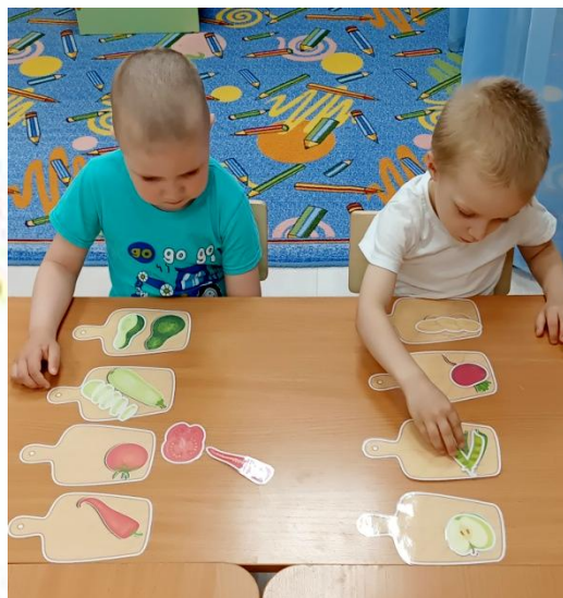
Д/и «Целое и половинка»