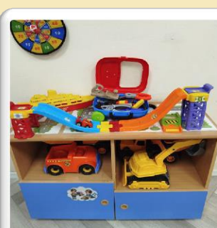
Центр игры для мальчиков

Включает куклы и аксессуары (одежда, коляски, домики); предметы домашнего обихода (игрушечная посуда, утюги, пылесосы); материалы для творчества (бисер, ленты, ткани).