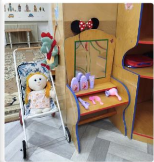
Центр сюжетно-ролевых игр

Оснащён атрибутами для имитации различных социальных. Здесь дети развивают коммуникацию и навыки сотрудничества, погружаясь в различные жизненные ситуации.