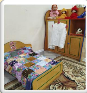
Центр игры для девочек

Представлен строительными наборами и конструкторами, стимулирующими логическое мышление и мелкую моторику.